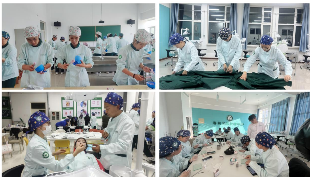
口腔护理实操训练课程