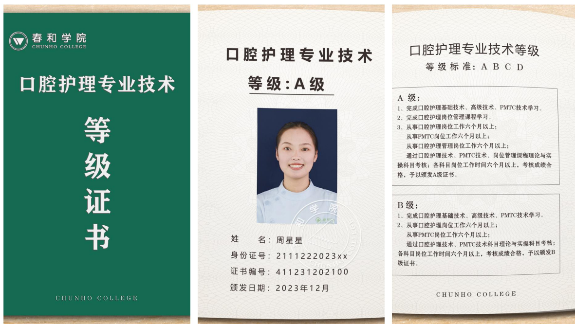
春和学院《口腔护理等级证书》

春和公司针对订单班学生们完成专业课程学习、实习、考核达标后，自愿选择就业春和公司的学生们，春和公司保障 100%入职春和公司，通过校企合作也为学生们提供了一个高质量就业与发展的企业平台。