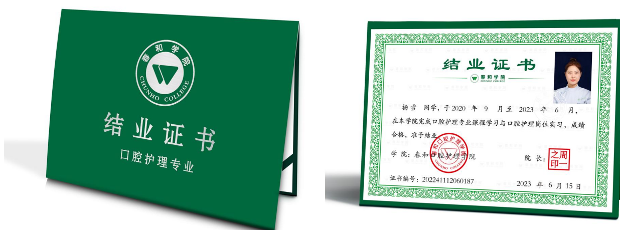
春和学院《口腔护理技能结业证书》

订单班毕业由春和公司颁发《口腔护理技能结业证书》，学生们可申请参加由春和公司校企合作学院共同认证的《口腔护理等级证书》考核，按考核成绩颁发等级认证证书。