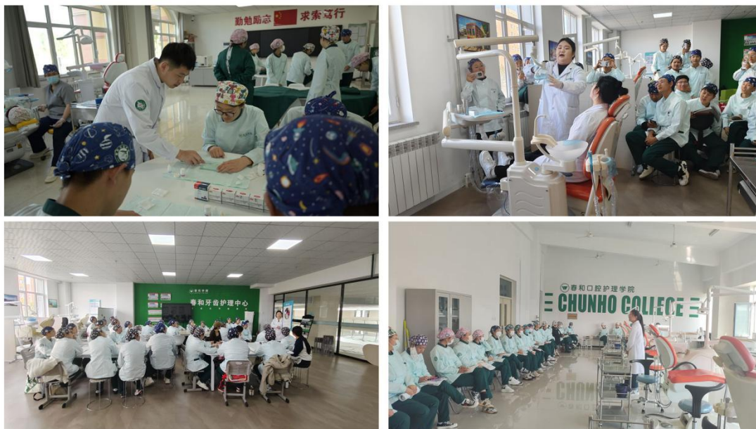
口腔护理课程教学