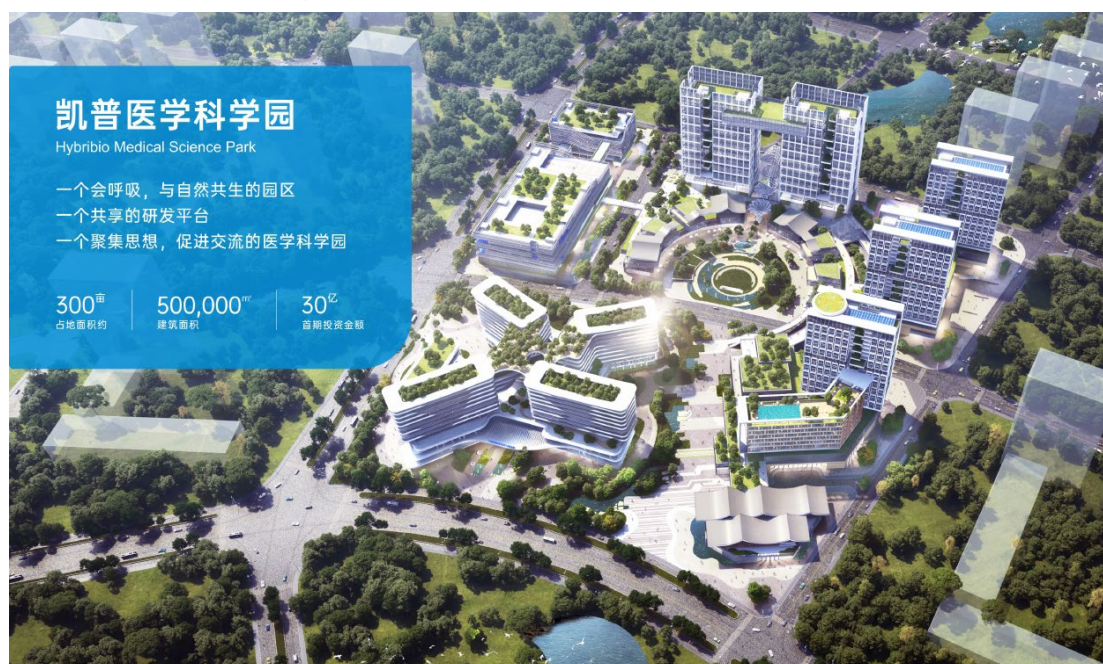
图 1. 凯普医学科学园俯视图

的民族企业，凯普邀请优秀毕业生，并肩投入生物医药领域前沿探索，为国家的繁荣发展添砖加瓦。