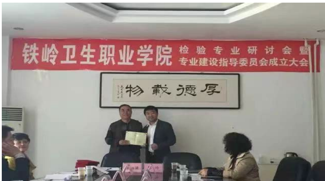
图 4. 集团专家加入铁岭卫生职业学院检验专业建设指导委员会