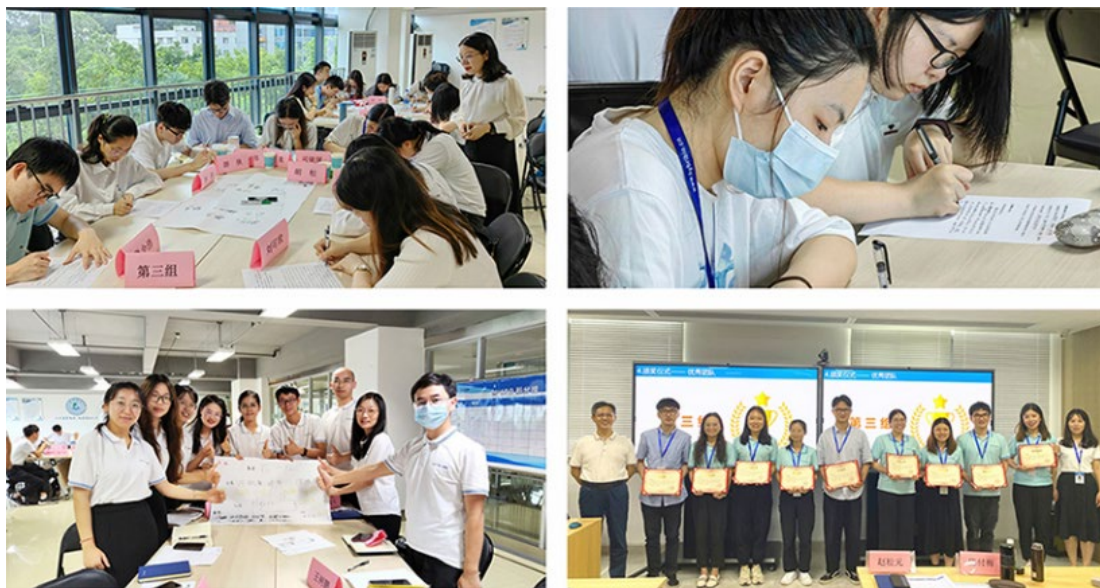
图 2. 学生实践学习

就业、特色专业凯普班（订单班）、师徒制学历提升班合办、研究生（硕士、博士）联合培养、博士后工作站合作、专家资源共享、产业学院共建、科研项目合作、联合实验及科研中心共建、第三方医学检验实验室共建、专业教材编写及论文发表、国家或省重点项目申报等。