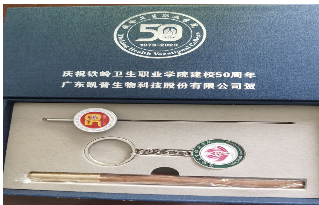
图 3. 同贺铁岭卫生职业学院 50 周年

优异的学生提供奖学金。凯普主动提供经费支持学生技能大赛、奖励优秀学生等。2023 年恰逢铁岭卫生职业学院建校 50 周年，凯普集团为学校提供了校庆纪念品。