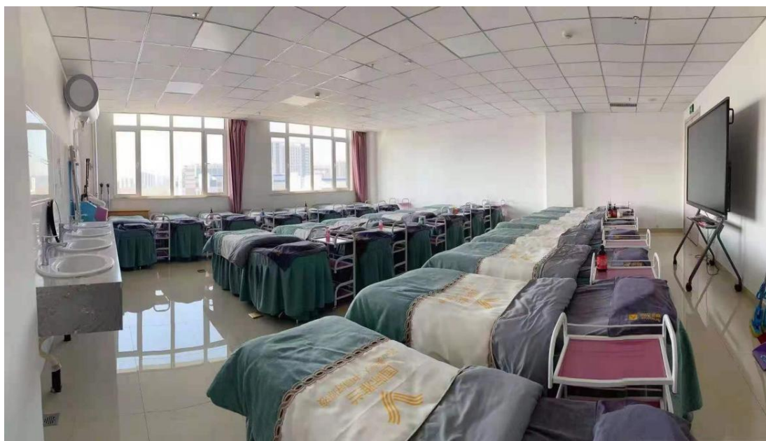
图 7. 援建学院校内实训室