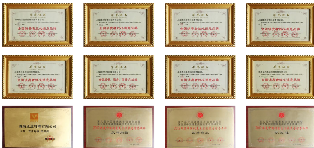
图 1. 企业荣誉