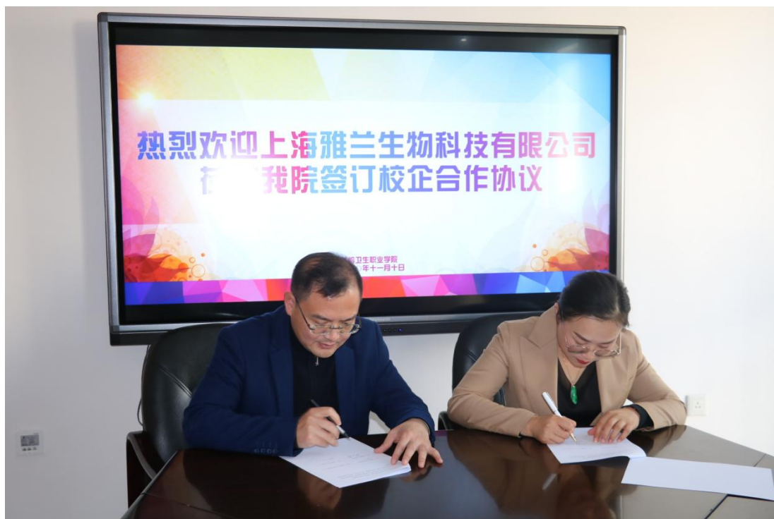
图 4. 公司领导与铁岭卫生职业学院领导签订校企合作协议