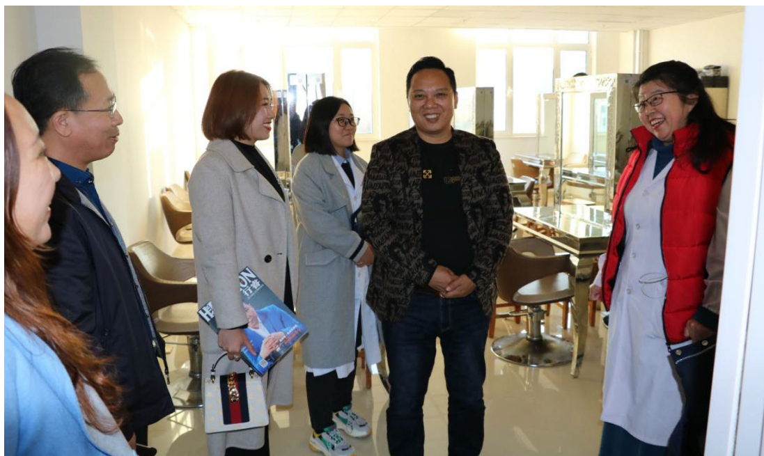
图 2. 公司领导在铁岭卫生职业学院参观考察

地建设、美容院发展规划、科技研发推广等诸多领域达成合作共识，拓展了产业链条，形成了多点、多元支撑的发展格局。