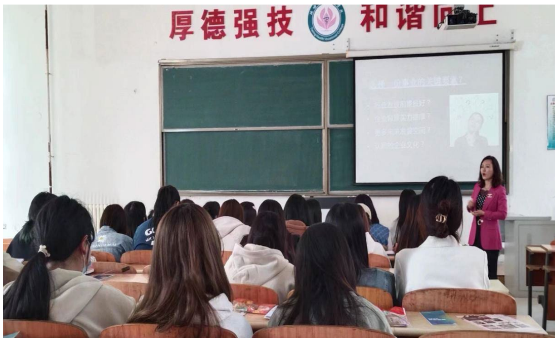
图 5. 企业导师下校园授课