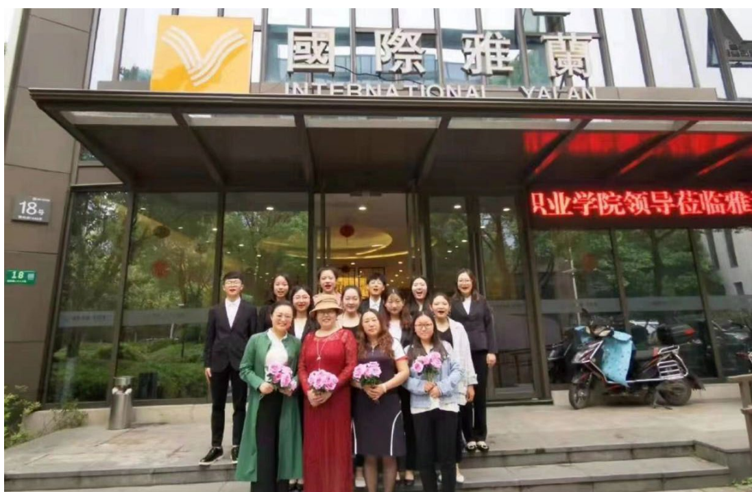
图 3. 铁岭卫生职业学院领导及教师莅临我公司