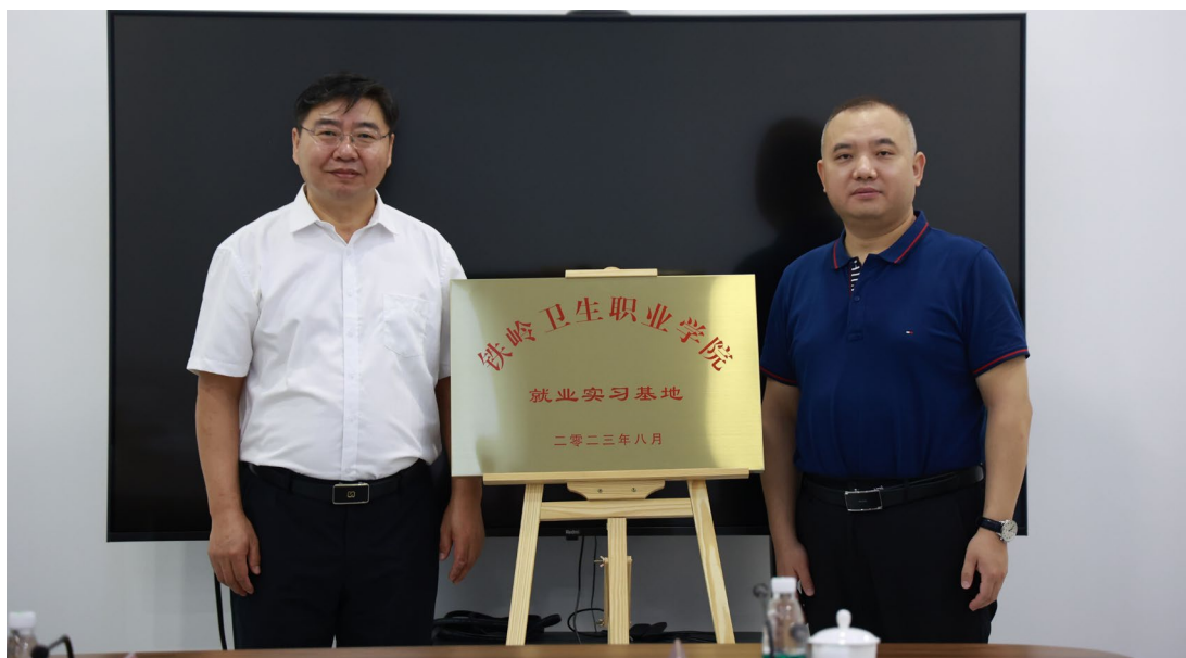
图 2. 铁岭卫生职业学院就业实习基地揭牌仪式

校企合作深度融合不仅使校企双方的资源完美融合，也辅助学校完善专业人才培养、提升学生实操能力、拓展实训建设、规范教学管理，更推动企业完善人员选拔、人员培养、提高企业社会服务能力。