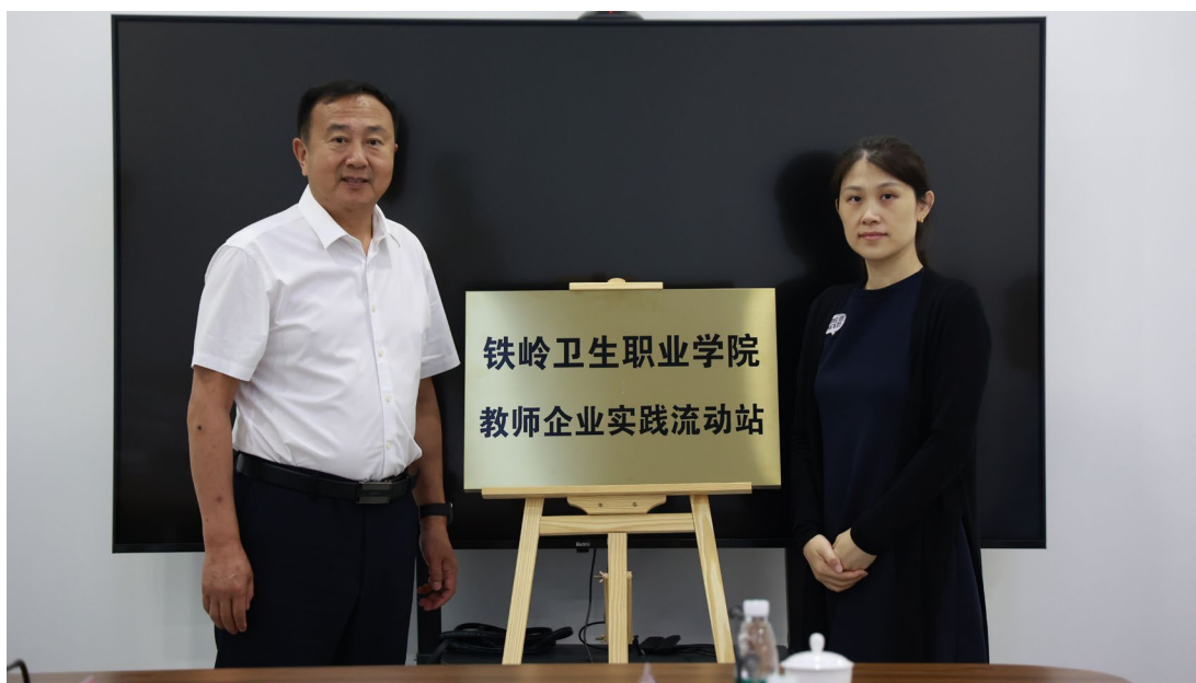
图 3. 铁岭卫生职业学院教师企业实践流动站揭牌仪式