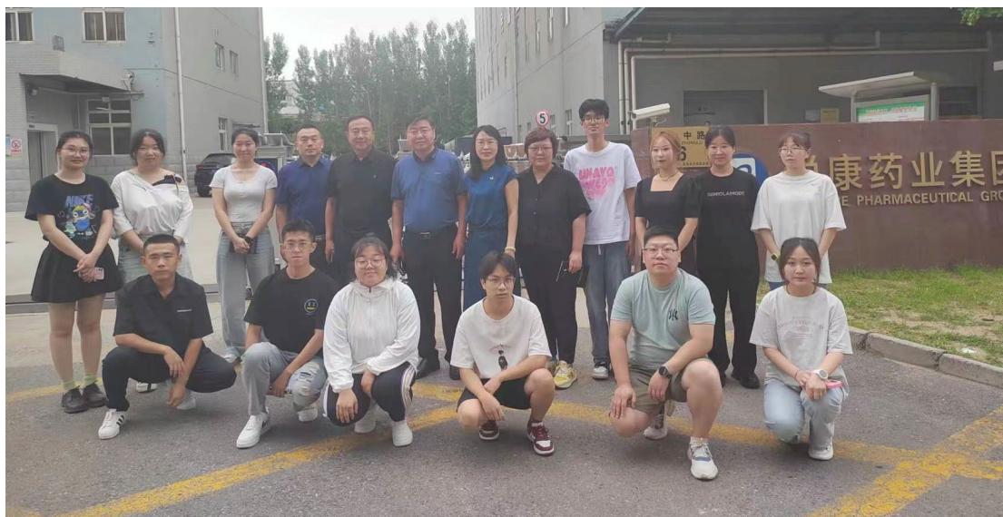
图 4. 已就业学生代表与学院走访领导合影

悦康药业集团目前以悦康班以及师徒帮带的模式培养为主，培养的方向较为单一，人数较少，无法满足集团对人才数量和专业性的要求。企业参与职业教育，为行业提供人才，需要投入大量的人力和物力，而且需要协调企业各方面资源，以配合教学实施，企业内部往往会形成阻力，从而影响产教融合的深度和范围。