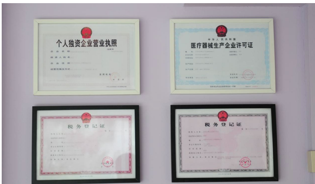
图 1 沈阳金赛义齿制作中心企业资质

沈阳金赛义齿制作中心成立于 2001 年，目前是辽沈地区规模较大、研发品类较全、业务覆盖范围较广、服务口碑较佳的义齿制作机构。公司成立 20 余年，始终致力于“再现完美笑容”的品牌使命，用最真诚的服务、最优质的产品链接每一位合作伙伴。践行“客户至上”的服务理念，在业内产生了影响深远的文化口碑。公司布局战略以沈阳总部为核心，辐射周边吉林、内蒙、河北、山东等省会，力争覆盖全国一二线城市。同时打通口腔义齿行业壁垒，实现全产业链条、全业务体系不断向全国义齿市场纵深发展的宏伟蓝图。