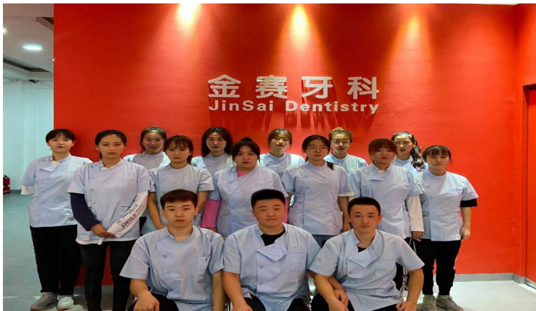
图 5 在沈阳金赛义齿制作中心工作的我院毕业生