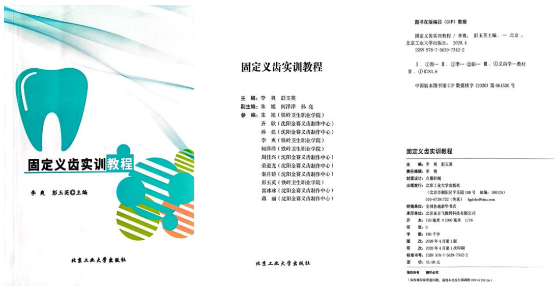
图 10 沈阳金赛义齿制作中心与口腔系共同开发校企合作教材

2021 年校企合作完成网络课程建设，专业核心课《固定义齿》《全口义齿》《可摘局部义齿》。企业配合学校完成照片及视频的拍摄，提供设备、场地、技师等，完成校企合作教材《固定义齿实训教程》，由北京工业大学出版社正式出版，面向全国发行。