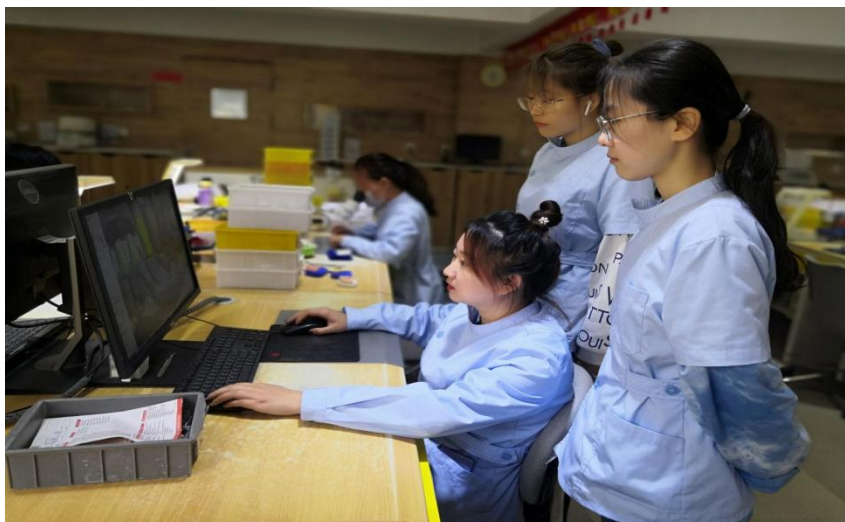
图 6 沈阳金赛义齿制作中心企业技师指导学生操作