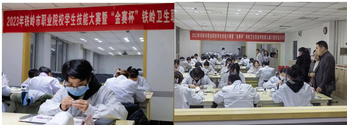
图 9 沈阳金赛义齿制作中心赞助学生技能大赛 企业老总亲临比赛现场