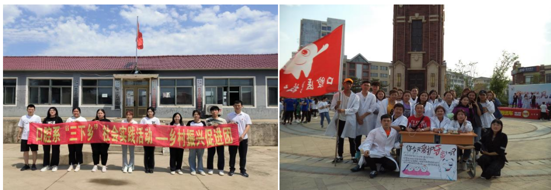
图 14 口腔系学生社会实践