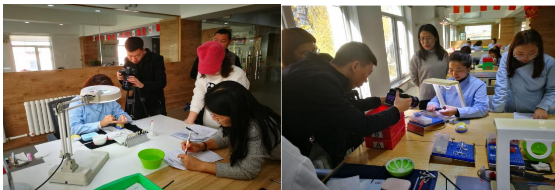
图 11 在沈阳金赛义齿制作中心录制网络课程