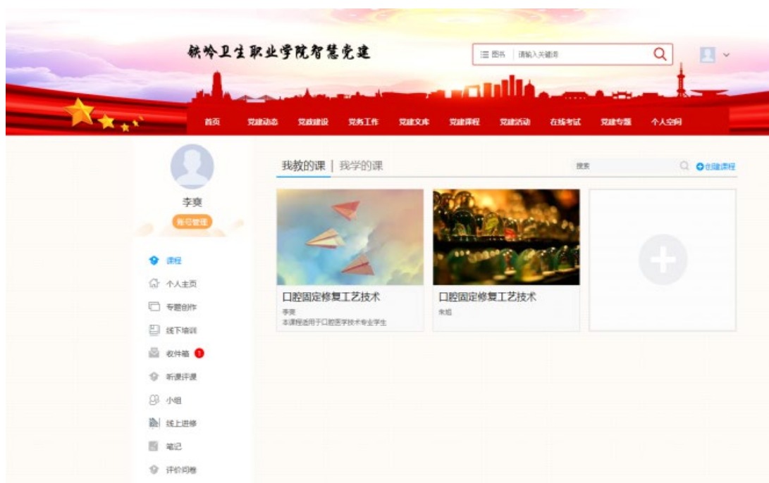
图 12 沈阳金赛义齿制作中心与我院合作完成的网络课网页截图