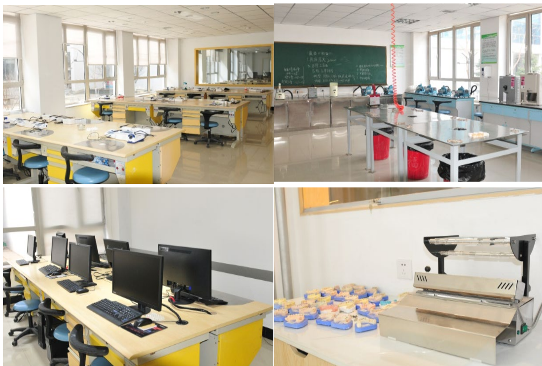
图 7 沈阳金赛义齿制作中心为口腔系捐赠的仪器设备

为解决职业技术学院实训室缺乏教具问题，2016 年沈阳金赛义齿制作中心出资为学院建设口腔系实训基地，并捐赠技工台、烤瓷炉、气泵、电脑等设备。并派出多名技师在校配合校方教师对学生进行技能培训。