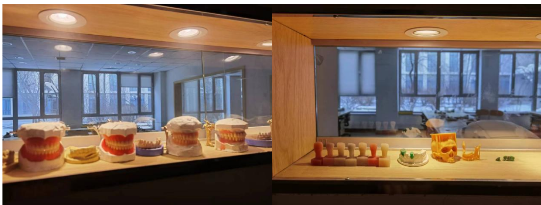
图 15 沈阳金赛义齿制作中心为我院建设实训基地缩影

沈阳金赛义齿制作中心全程参与学生的培养，学生进入沈阳金赛义齿制作中心顶岗实习及就业。2017年7月以企业生产流程为导向建设实训室，沈阳金赛义齿制作中心为口腔系实训基地投资14万余元，改建了口腔修复技术中心。对实验楼A-103~109室进行改建，完善了水、电、气、排尘等设施改造，仿义齿企业生产设置实训室，实训室功能更加突出数字化实训中心理念，新增设的CAD-CAM实训室.实训室填补我院牙科数字化课程的空白。