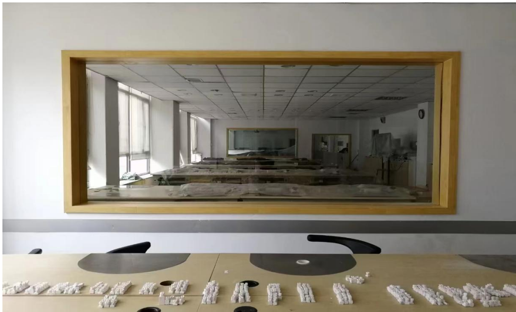
图 4 沈阳金赛义齿制作中心为我院建设的实训基地

4.职业素养培养：沈阳金赛义齿制作中心注重学生职业素养的培养，通过企业文化传播、职业道德教育等方式，帮助学生树立正确的职业观念和职业道德意识。