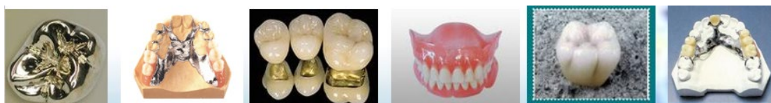
图 3 沈阳金赛义齿制作中心产品展示

2.课程设置：沈阳金赛义齿制作中心结合行业实际需求，开发了一系列具有实用性的课程，如全瓷修复技术、金属烤瓷技术、数字化设计、义齿制作技术等。