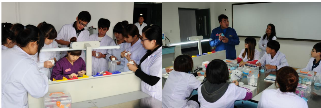
图 8 沈阳金赛义齿制作中心企业技师来院为学生授课

2023 年 11 月 21 日，由铁岭市教育局组织，铁岭卫生职业学院口腔系承办，由沈阳金赛义齿制作中心赞助的“金赛杯”2023 年职业院校学生口腔技能大赛，取得圆满成功。