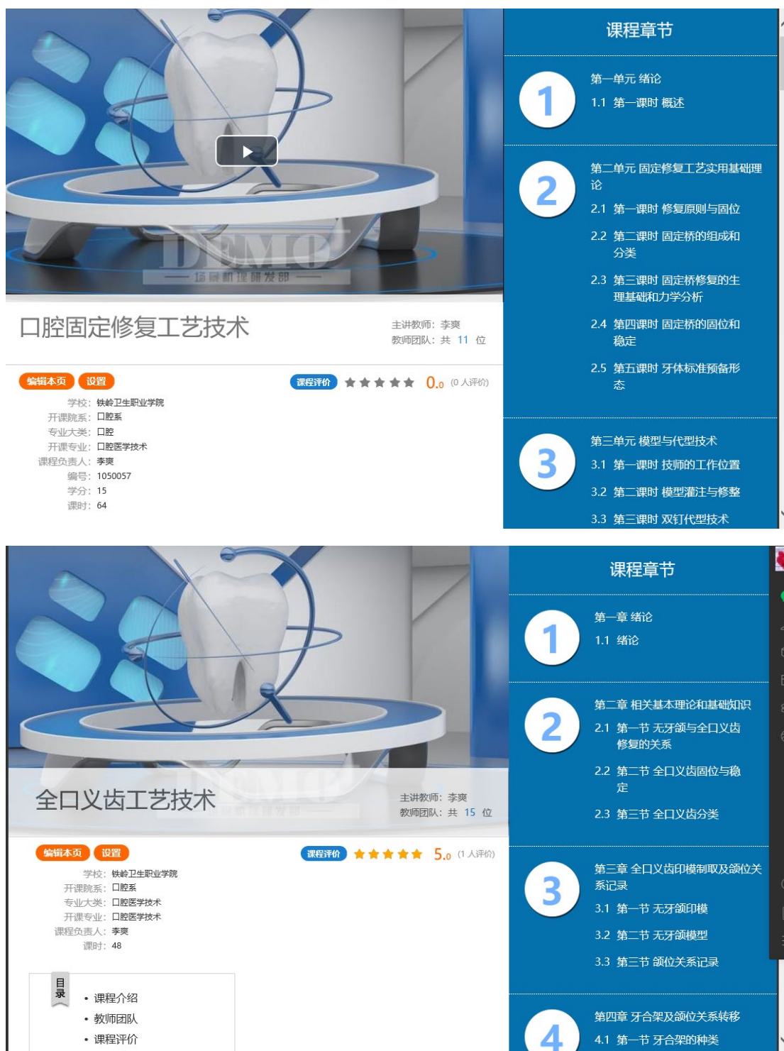
图 17 与沈阳金赛义齿制作中心合作的网络课