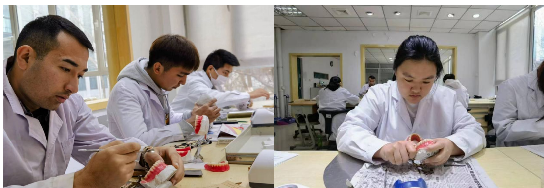
图 13 口腔系学生日常练习

课程建设是专业建设的一部分，课程建设必须围绕专业建设和专业人才培养的要求来进行。学院在进行课程设置时始终以学习者为中心，为不同层次不同类型的学生提供个性化、多样化、高质量的教学服务。实施“五育并举”，培养“德智体美劳”全面发展的社会主义建设者和接班人；推行“课程思政”改革，构建立体化、全方位立德树人新生态；打造 4 门专业核心课程网络课程建设，形成“互联网+职业教育”新形态；实施“课堂革命”，推行以超星智慧教学平台为载体，以混合式教学为手段，以远程协作、实时互动、翻转课堂、移动学习为特征的信息化教学模式改革；推行“线上学习+线下实操+线上线下讨论”的混合教学方式，建立适应混合式教学方法的学生考核、教师教学质量评价方式。